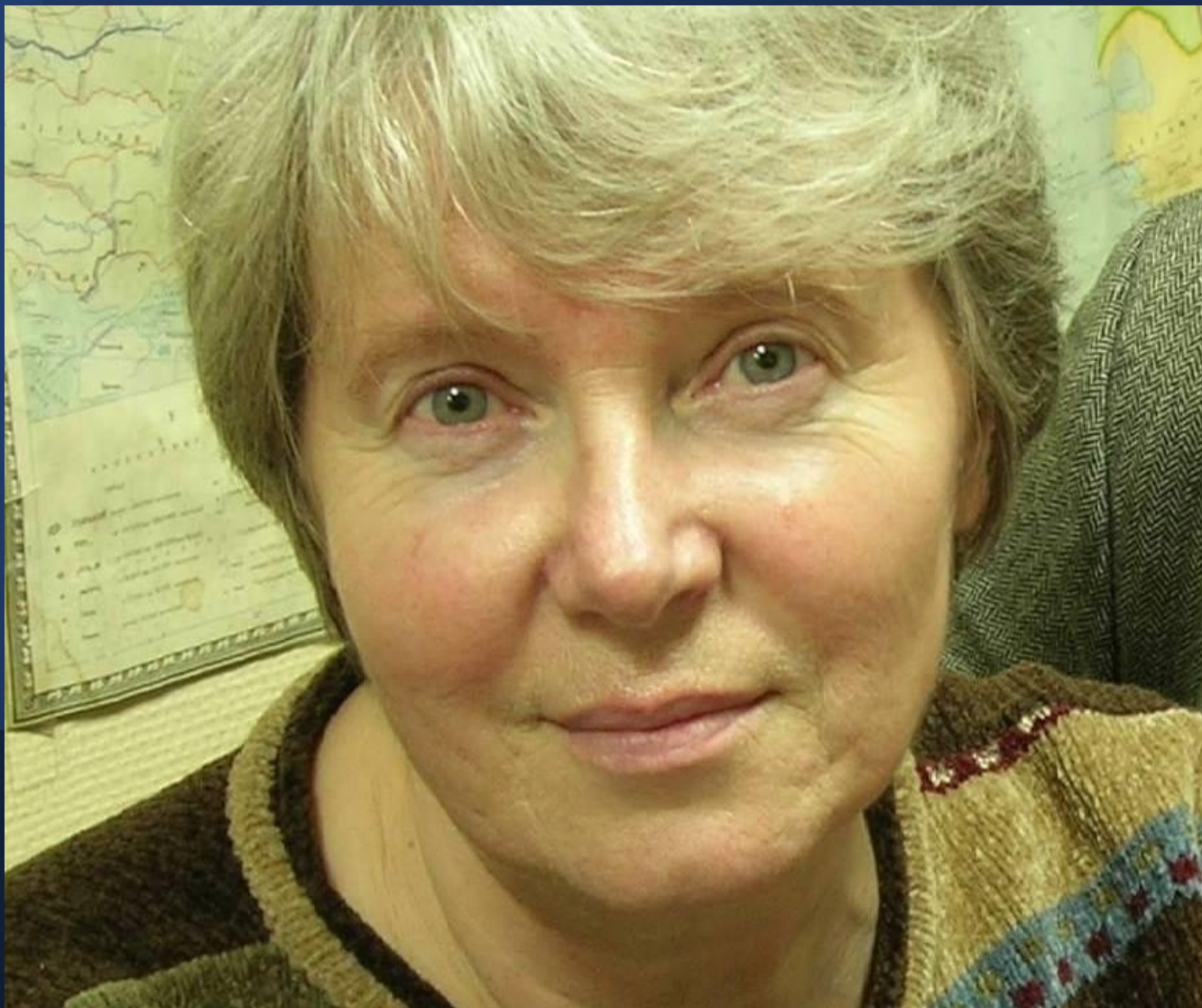
Алла Владимировна Краско (7 февраля 1949-7 апреля 2022)